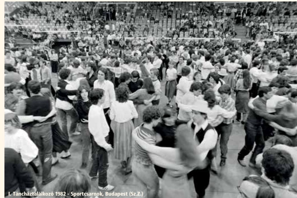
I. Táncháztalálkozó 1982 - Sportcsarnok, Budapest (Sz.Z.)

A z évtizedek folyamán a táncházmozgalom egyre elismertebb lett. Míg sokáig ódzkodtak más zenei ágak képviselői egyenrangúnak elismerni a népzénet, ma már a Zeneakadémián ( Liszt Ferenc Zeneművészeti Egyetem ) Népzene Tanszék működik, s az országban számos alap- és középfokú zeneiskolában lehet népzénet tanulni. A népi kultúra ápolásának külön csúcsintézménye van 2001 óta: a Hagyományok Háza . Az UNESCO 2011-ben Szellemi kulturális örökség listára vette a táncházmozgalmat, mint a hagyományok megőrzésének példamutató gyakorlatát. ■