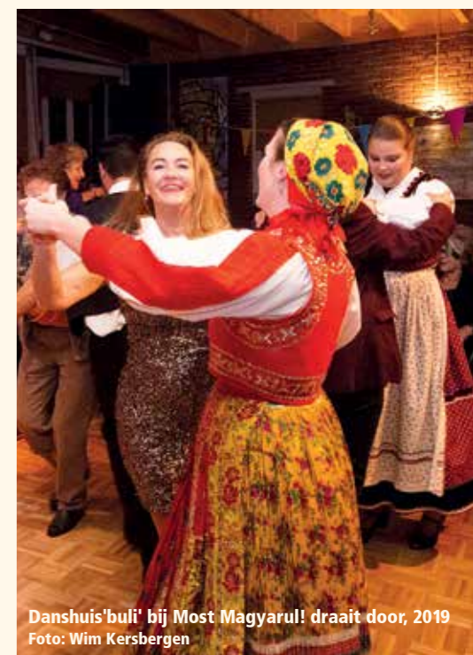
Danshuis'buli' bij Most Magyarul! draait door, 2019

D e musici hebben de Hongaarse muziek geleerd van Hongaarse groepen die in Nederland concerten hebben getoerd zoals Muzsikás , Téka en Dűvő . Ook heeft het trio cursussen gevolgd in Hongarije en Transsylvanië. En alle drie hebben ze Hongaars geleerd! ■ (Red.)