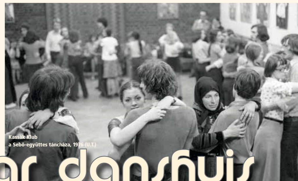
Kassák Klub a Sebő-együttes tánc háza, 1976 (U.T.)

Niet als in de meeste landen van Europa raakte in de jaren zeventig van de vorige eeuw de traditionele boerencultuur in Hongarije steeds meer in vergetelheid. De mensen wisten niet meer (en weten jammer genoeg vaak nog steeds niet) wat volksliederen, volksmuziek en volksdans eigenlijk inhouden. Velen dachten allereerst aan de zigeunermuziek zoals die in de restaurants klonk, of aan de sentimentele levensliedjes (nóták) die door componisten en tekstdschrijvers uit de grote stad werden geschreven. En de enige dans waar men nog wel van gehoord had, was de csárdás.